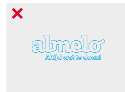
Het logo mag niet in outlines worden gebruikt

Het plaatsen van het logo is in principe vrij, maar er zijn wel een paar basisregels. Deze pagina laat zien wat er niet veranderd mag worden aan het logo.