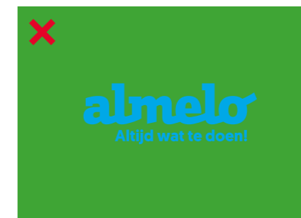
Het logo mag niet in kleur gebruikt worden op een kleur achtergrond