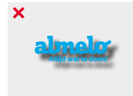
Geen schaduw / dropshadow gebruiken