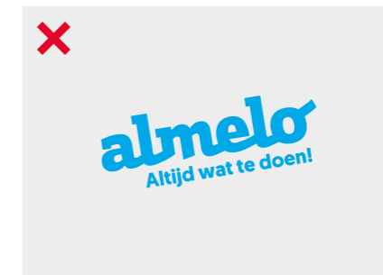
Het logo mag niet gekanteld worden