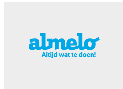
Het logo in blauw op een witte of lichtgrijze (10%) achtergrond

Het stadslago mag niet aangepast worden. Voor zover het mogelijk is, is het verplicht het logo in blauw te gebruiken. Op gekleurde achtergronden wordt het logo in het wit gebruikt.