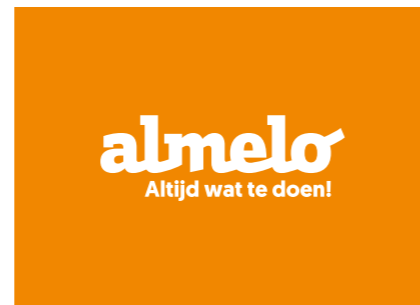
Het logo in wit op een oranje achtergrond. Alleen tijdens het seizoen