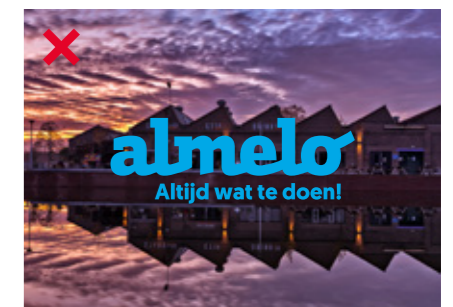
Het logo mag niet in kleur gebruikt worden op een foto achtergrond