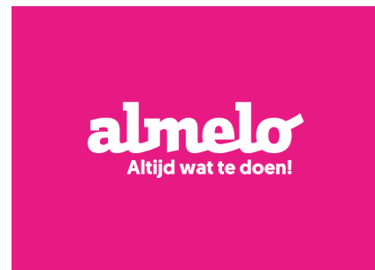
Het logo in wit op een magenta achtergrond. Alleen tijdens het seizoen