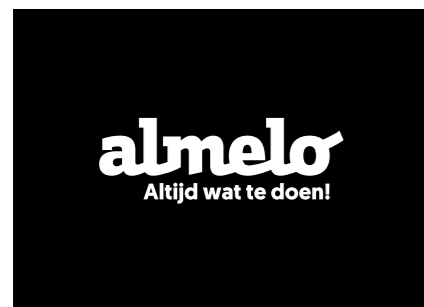
Het logo in wit op een zwarte achtergrond, alleen wanneer de kleur blauw geen optie is