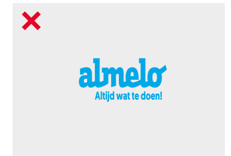
Het logo mag niet vervormd worden