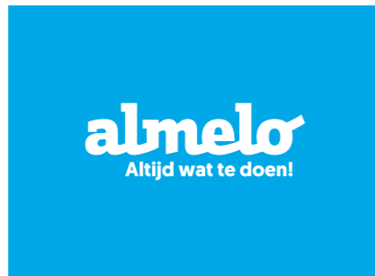
Het logo in wit op een blauwe achtergrond