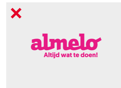
Het logo mag niet in andere kleuren worden gebruikt dan wit, blauw of zwart