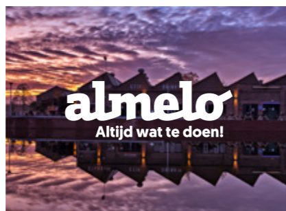
Het logo in wit op een foto achtergrond mits voldoende contrast blijft gewaarborgd