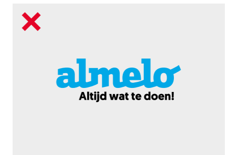
De kleur van het logo en de pay-off mogen niet verschillen