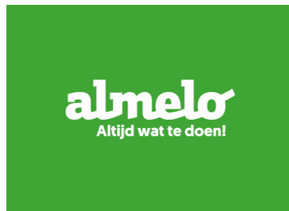
Het logo in wit op een groene achtergrond. Alleen tijdens het seizoen