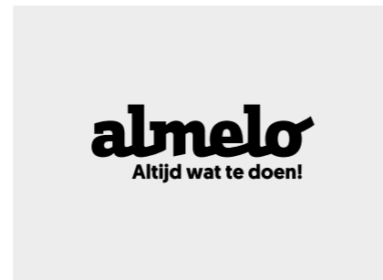
Het logo in zwart op een witte of lichtgrijze (10%) achtergrond