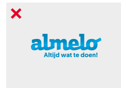
Geen kleurverlopen of andere effecten toepassen